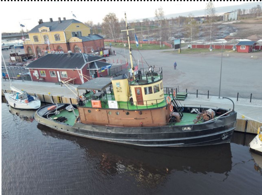
MERIKARHU, EX ST-79, No 13, DR-13.

hållet av båtarna, som är svåra att använda kommersiellt. Här kommer de sorterade enligt sina ursprungliga ST-nummer: